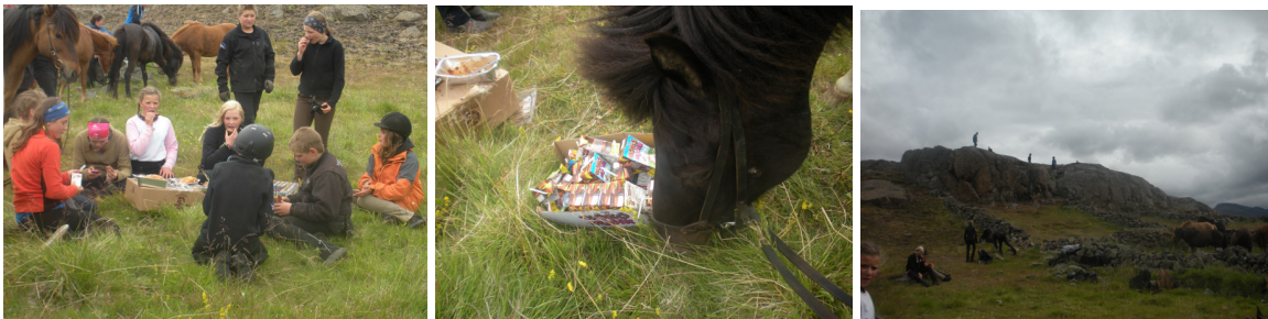
Alltaf gott að fá sér nesti!

Eftir hádegið var farið í reiðtúr upp að gömlu Borgarréttinni þar sem nesti var í boði og síðan riðið aftur á Melana um Saurbæ. Um kvöldið var grillveisla og varðeldur auk verðlaunaafhendinga fyrir þær þrautir sem búnar voru.