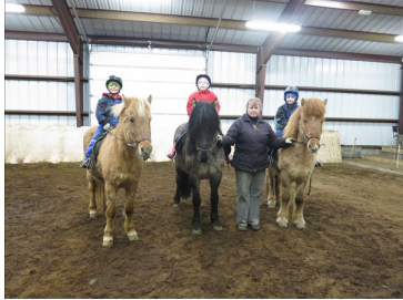
Yngsti hópurinn, óvanir

Barna- og unglingaráð Funa hóf starfsemina á árinu með því að auglýsa reiðnámskeið á Melgerðismelum í apríl. Í samstarfi við hestaleiguna Kát var mögulegt að útvega hestlausum en áhugasömum krökkum hesta til að komast á námskeiðið og var þátttakan góð, 14 krakkar frá 5 til 15 ára mættu til leiks.