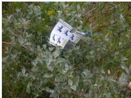
Það leyndist ýmislegt í runnum, m.a. gangtegundaþrautin....

Þátttakendum var skipt upp í lið á föstudagskvöldinu þar sem liðin voru ræst af stað með mismunandi millibili til að fara í gegnum ratleikinn og leysa hinar ýmsu þrautir, s.s. að finna ákveðinn ávöxt á trjám (sem eru nokkur á Melgerðismelum!), finna allar stöðvar og svara spurningum um gangtegundir, hestaliti og svæðið sjálft. Þá þurfti að flétta fax og negla nagla í spýtu svo fátt eitt sé nefnt.