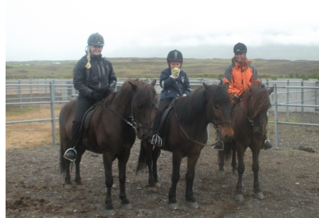
Sigurliðið í ratleiknum – ávöxturinn fundinn og hálfétinn!!!

Laugardagurinn hófst með þrautabraut þar sem hver og einn knapi fór með sinn hest gegnum braut á tímatöku. Fara þurfti um aðþrengt, afmarkað svæði, taka kútskaft úr