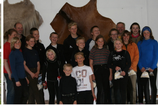
Barna-og unglingaráð með krakkahópnum góða !