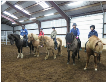
Miðhópurinn, óvanir/lítið vanir