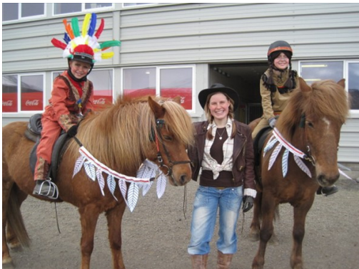
Systkinin frá Kálfagerði mætt til leiks í "Villta vestrið."