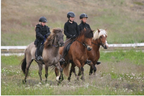
Sigurlíðið í sunnudagskeppninni.