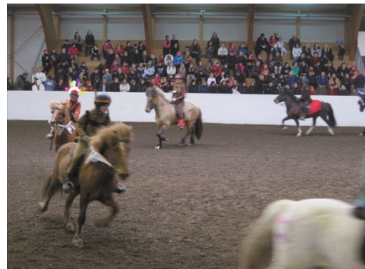
Einbeittir indíánar og kúrekar, allt á fullu !